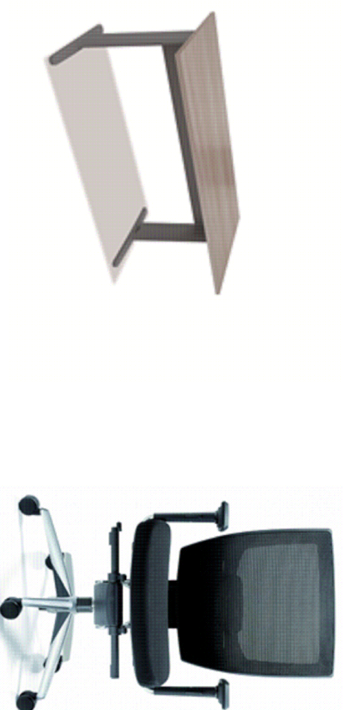
MESA RETA SISTEMA Z