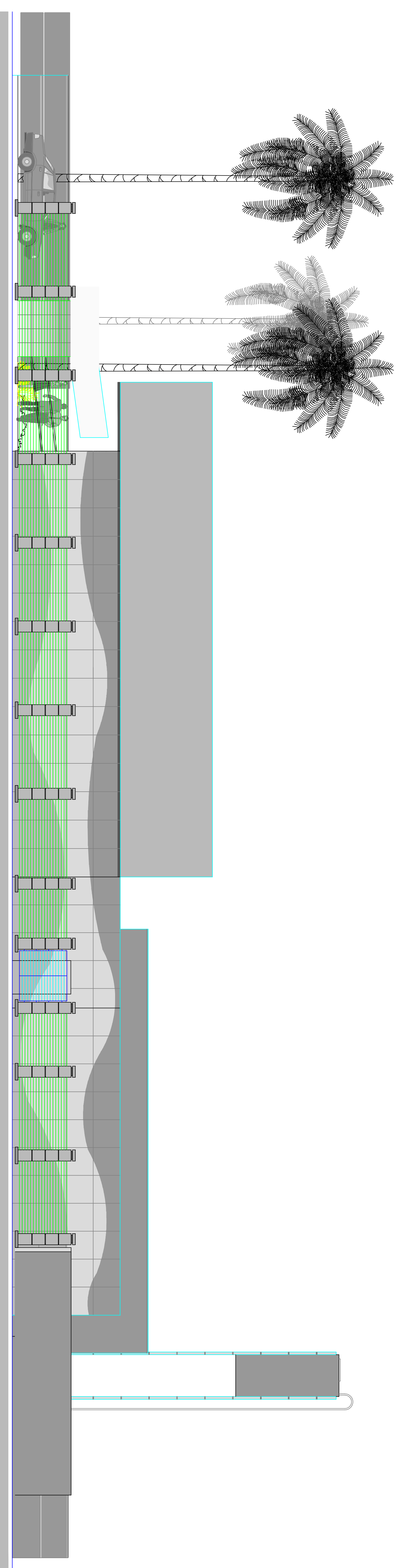
FACHADA LATERAL OESTE ESCALA 1:100